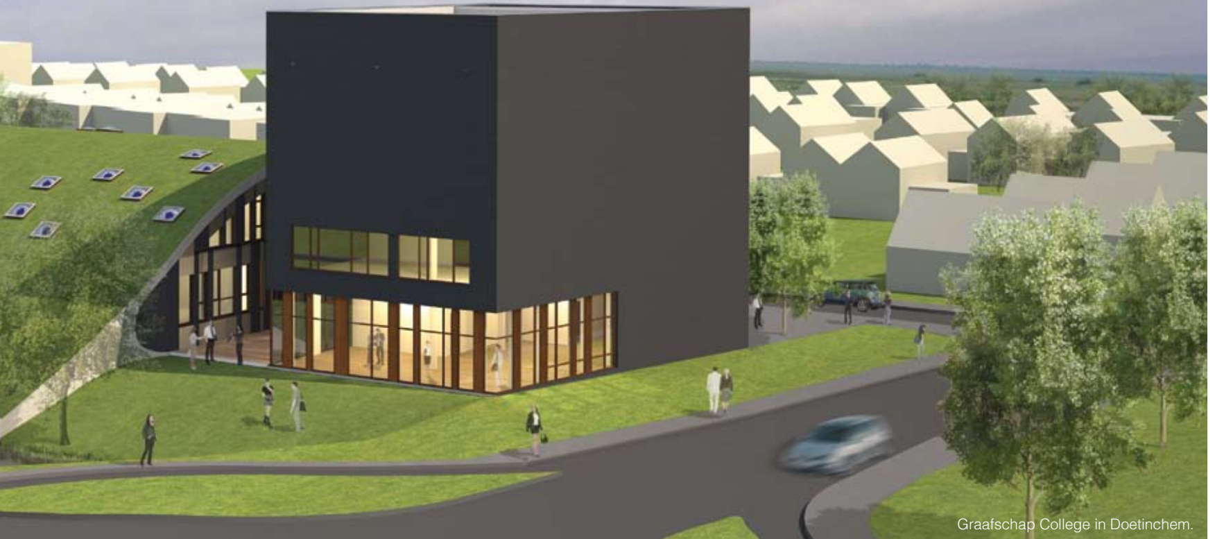
Graafschap College in Doetinchem.

Auteurs: Karin de Mik en Wijnand Beemster