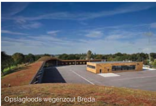
Opslagloods wegeenzout Breda.