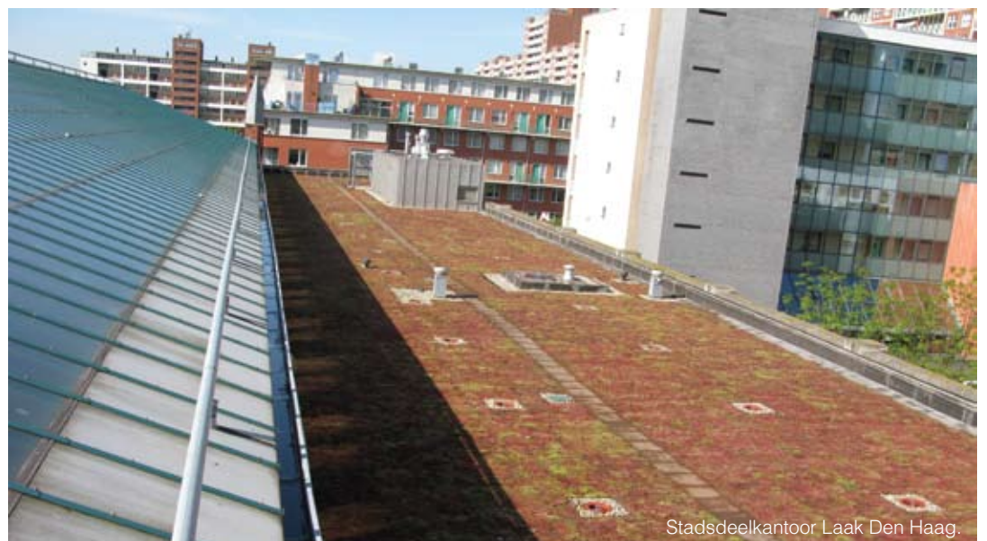
Stadsdeelkantoor Laak Den Haag.

De regeling in Den Haag is geïnspireerd op binnen- en buitenlandse voorbeelden, zegt Klaaijzen: "Den Haag heeft contact gehad met Rotterdam en Groningen, die al een subsidieregeling hebben. Ook ►