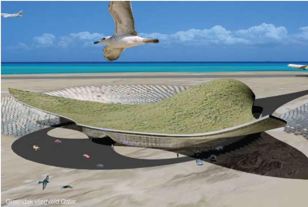
Groendak vliegveld Qatar.

heeft Den Haag naar het buitenland gekeken. Antwerpen en Malmö zijn voorbeeldsteden waar groene daken al vergevorderd zijn.”